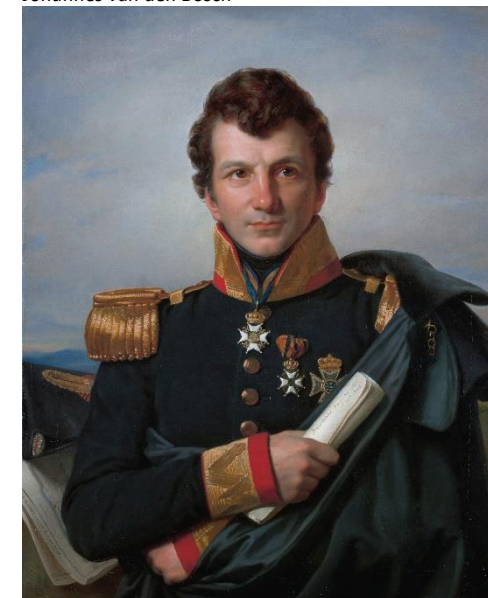
Johannes van den Bosch