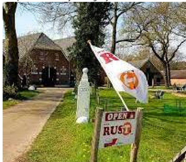
Rustpunt Plukuin Reef Zondagwandeling 17 sept.