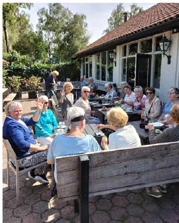
Rustpauze Buitenhof zondagse fietstocht