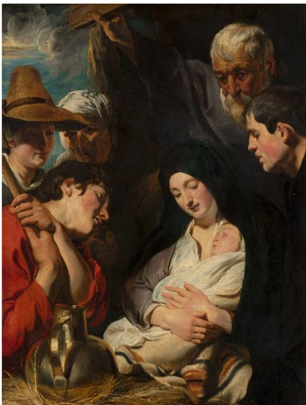
Jacob Jordaens 1617, Mauritshuis