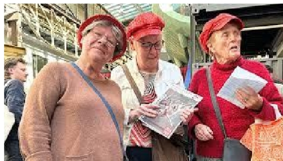
Onze slingerbeursbezoekers met rode hoedjes

In het vervolg van het seizoen leest u er zeker meer over.