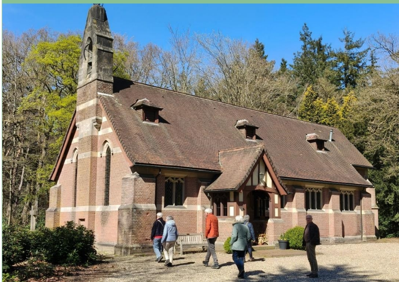
St. Mary's Chapel – Kasteel Weldam