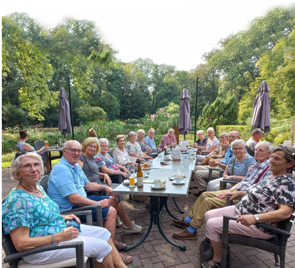
Uitrusten en nagenieten bij Erve 't Hulsbeek