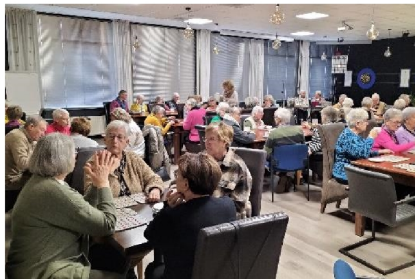
Nieuwjaar met Bingo – 09/01/2025