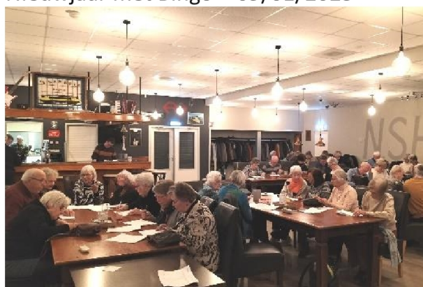
Senioren aan zet – 16/01/2025