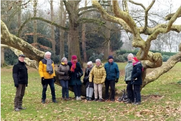
Bij de grillige plataan in het Kalheupinkpark

Na onze mooie februariwandeling tussen de Wilmersberg en park Kalheupink genoten we bij 't Kruisselt van de koffie.